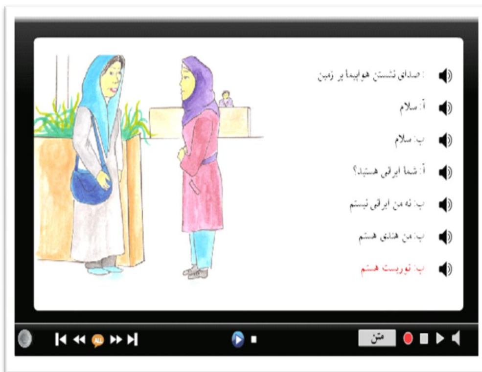
تصویر ۷. اسلاید طراحی‌شده برای ارائه‌ی محتوای خواندن و شنیدن

ابزارهای تصویری، پویانمایی و فیلم‌ها نیز می‌توانند به‌عنوان ابزارهای کمکی در کنار متن مطرح باشند، ترتیبی اتخاذ شد که یک اسلاید گفتگوی خواندن یا شنیدن، ترکیبی از متن، صدا، تصویر و فیلم باشد. با این رویکرد، یکی از گره‌های محتوایی هر نشست، ارائه‌ی اسلاید تعاملی برای یادگیری مهارت‌های شنیدن و خواندن تعریف شد. در این‌جا استادِ طراح درس می‌تواند یک گره به‌عنوان اسلاید مکالمه بسازد و محتوای متن، صدا و تصویر را داخل تنظیمات اسلاید وارد کند. بدین ترتیب در زمان نمایش اسلاید، این محتوا به صورت خودکار از پایگاه داده‌ی درس بازیابی می‌شود و داخل یک محیط چندرسانه‌ای به نمایش گذاشته می‌شود (تصویر ۷). در این محیط، زبان‌آموز می‌تواند تمامی متن را با هم بشنود و یا به صورت انتخابی، هر خط را جداگانه بشنود و بیاموزد. این ابزار یک امکان مهم دیگر نیز دارد و آن هم امکان ضبط صدای زبان‌آموز است.