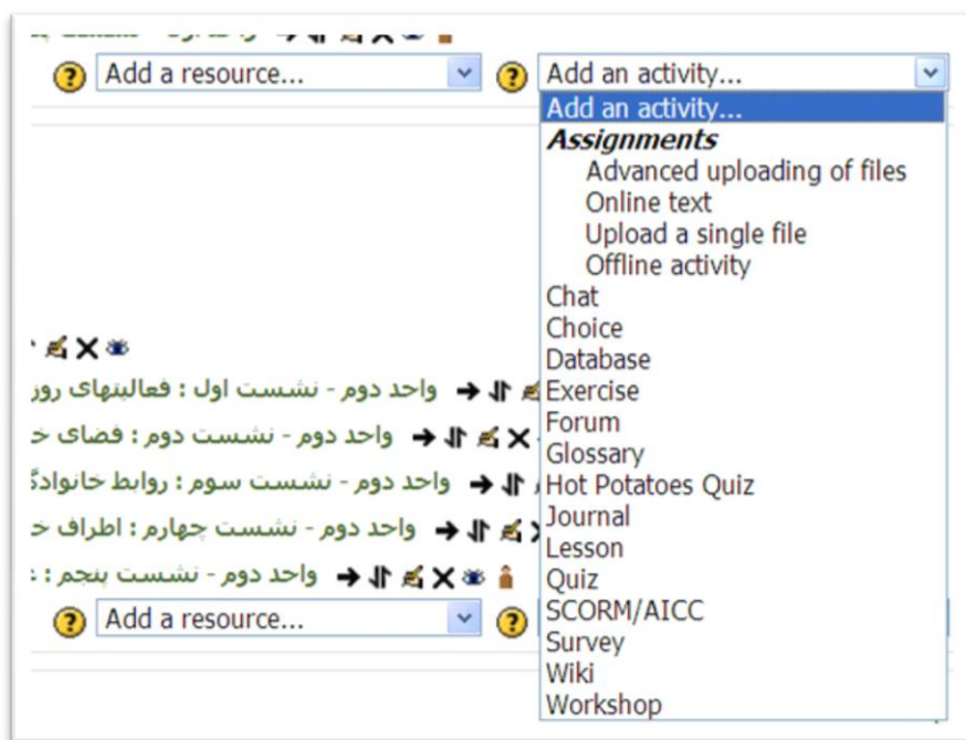
تصویر ۲. تعریف جستار برای افزودن یک فعالیت درسی