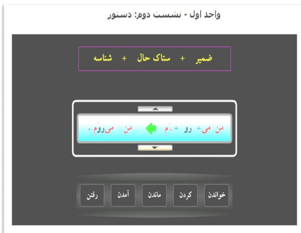
تصویر ۹. یک نمونه ابزار تعاملی برای یادگیری صرف فعل

یکی دیگر از زیرمهارت‌های زبان فارسی، زیرمهارت دستور زبان است. تنوع قواعد و نکات دستوری تا حدی بالاست که ساخت یک قالب برای آموزش تمام آن‌ها امری غیرممکن است. از این رو در این طرح پژوهشی، به ازای هر یک از نکات دستوری مورد نظر، یک اسلاید تعاملی به صورت مستقل ساخته شده است (تصویر ۹) که در گره‌های محتوایی بدون اتصال به پایگاه داده، در جریان درس بارگذاری می‌شود. زبان‌آموز در این قالب می‌تواند با حرکت ضمیر، نحوه‌ی صرف افعال را تمرین کند. از آن‌جا که نیاز به اسلایدهای مستقل از یک ساختار واحد، که در قالب خاصی نمی‌گنجد، در تمام مراحل طراحی درس مشاهده شد، یک گره مخصوص درج این‌گونه اسلایدهای مستقل در ماژول درسی پیش‌بینی شد.