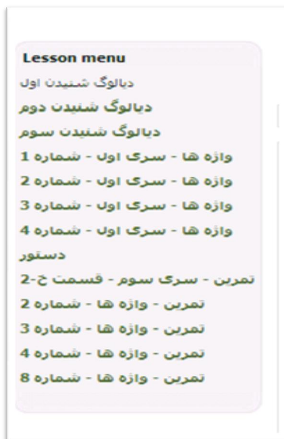
تصویر ۶. منوی ناوبری برای محتوای مشاهده‌شده

۲. با کنترل حرکت در داخل یک نشست؛ در هر گره محتوایی، استاد می‌تواند بر مبنای محتوا و انتخاب زبان آموز، جریان حرکت را تعریف کند. در این حالت، تجربه‌ی همه‌ی زبان آموزها یکسان نخواهد بود. این قابلیت، فرآیند یادگیری را پویایی می‌بخشد. علاوه بر کنترل جریان گره‌ها، یک کنترل دیگر نیز در هر گره طراحی شده که امکان بازبینی گره‌های گذرانده‌شده را می‌دهد. این کنترل‌ها به صورت یک منوی ناوبری ۱۵ در حاشیه‌ی یک نشست به زبان آموز امکان بازبینی گره‌های قبلی را می‌دهد (تصویر ۶).