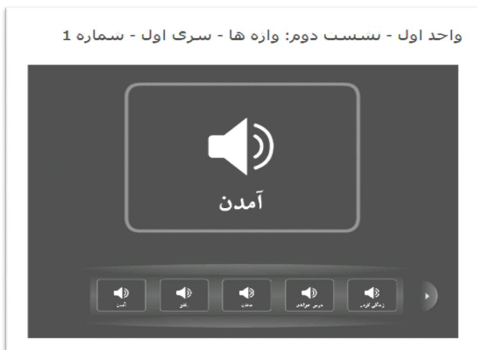
تصویر ۸. نمونه‌ی ابزار تمرین واژگان

در این طرح پژوهشی، یادگیری واژگان یک زیرمهارت محسوب می‌شود. زبان‌آموز علاوه بر این که باید به معنای یک واژه پی ببرد، باید با نگارش، نحوه‌ی خواندن و تشخیص آن در زمان شنیدن نیز آشنا شود. برای این منظور باید ابزاری طرح‌ریزی می‌شد تا قابلیت طراحی آموزش واژگان برای استادان و طراحان دروس فراهم آید. یکی از این راه‌ها ساخت یک فلش کارت تعاملی ۱۶ بود که در هر دو طرف کارت، قابلیت درج صدا، تصویر و نوشتار یک واژه وجود داشته باشد (تصویر ۸). در این صورت طراح درس می‌تواند به تناسب نیازهای واژگانی مربوط به یک درس، اسلاید واژگان را طراحی نماید. این ابزار، تعاملی است و در آن زبان‌آموز می‌تواند با چرخاندن کارت، حافظه‌ی خود را برای یادگیری واژگان تقویت کند.