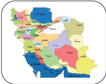
تصویر ۱. نقشه ایران