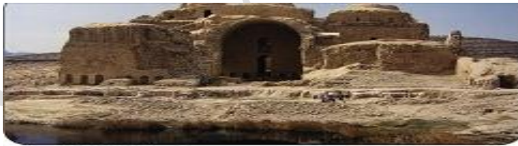
خرابه‌های کاخ فیروزآباد - فارس

از آنجایی که در تصویر کنشی صورت نمی‌گیرد و تصویر اساساً ثابت است، تصویر روایتی نیست، بلکه مفهومی و از نوع نمادین است؛ زیرا مشارکین فقط کاخ فیروزآباد است و نمادی از معماری ذکر شده دوره‌ی ساسانی در متن درس است. در ارتباط با معنای تعاملی می‌توان گفت تعاملی میان مشارکین در تصویر بازنمایی نشده است، یعنی ارتباط آشکاری مبنی بر خطاب مستقیم بیننده صورت نگرفته است. نمای باز تصویر و افراد کاوشگر در تصویر نشان دهنده‌ی انفصال افراد با مخاطب و عدم اهمیت وجود آن‌هاست و به‌صورت جزئی از تصویر نمایش داده شده‌اند. با توجه به رنگی بودن تصویر، وجه‌نمایی از نوع طبیعی و درجه‌ی بالای واقع‌گرایی است.