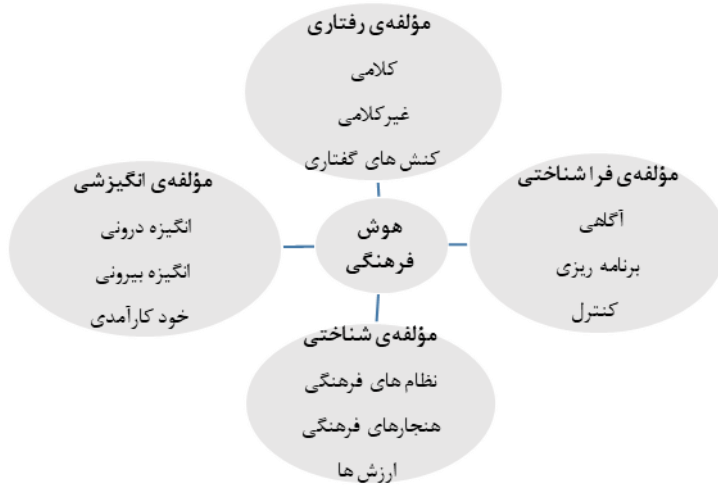
شکل ۱. انگاره‌ی مؤلفه‌های هوش فرهنگی (Ang & Van Dyne, 2008)

آنگ و همکاران (Ang et al., 2007)، هوش فرهنگی را سازه‌ای چندبعدی ۱ متراکم ۲ و ابعاد آن را دارای جنبه‌های مختلف یک قابلیت کلی توصیف کرده‌اند. ان‌جی و همکاران (Ng et al., 2012) و محققان مختلف درباره این موضوع توافق نظر داشته و برای این سازه ابعاد سه یا چهارگانه قائل بوده‌اند. جدول (۱) نظر پژوهشگران مختلف را در خصوص هوش فرهنگی و مؤلفه‌های آن به‌تصویر کشیده است (Ahmadi et al., 2013, p. 104).