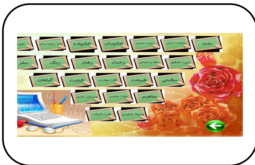
شکل ۲. فهرست موضوعی واژگان پایه

زبان‌آموزان با کلیک کردن بر روی این بخش، به قسمت اصلی نرم افزار یعنی فهرست موضوعی واژگان پایه منتقل می‌شوند که در این قسمت با ۲۳ موضوع مواجه می‌شوند. لازم به یادآوری است که موضوعات این بخش، برگرفته از کتاب «واژگان پایه‌ی فارسی از زبان کودکان ایرانی» می‌باشد.