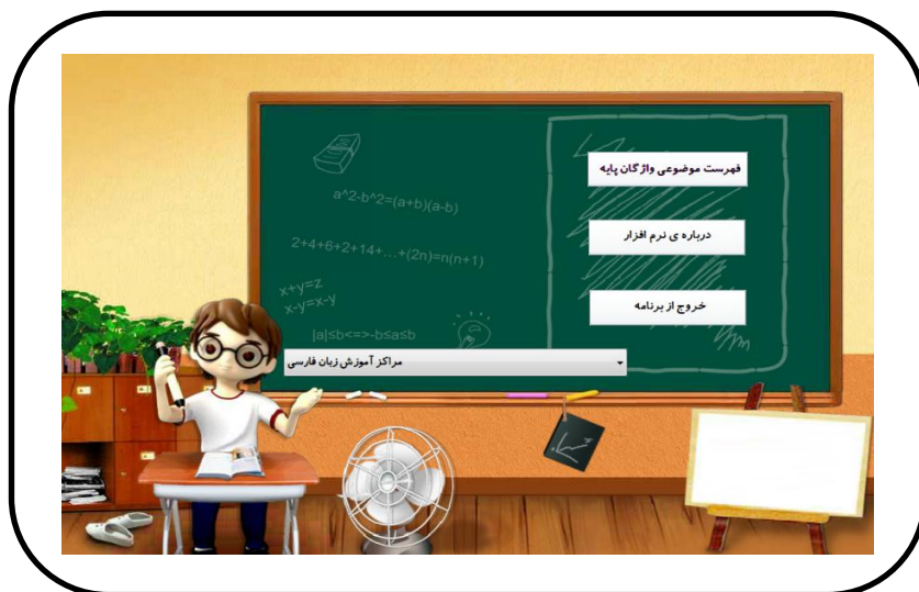
شکل ۱. صفحه‌ی نخست نرم‌افزار